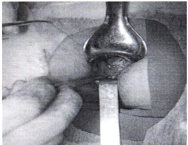
تصویر ۱- تکنیک York Mason

در این روش بیمار در حالت طاقباز و پاهایش در وضعیت ابداکسیون قرار گرفت. سپس پوست شکم از ناف تا سمفیز پوییس برش داده شد. پس از باز کردن لایه‌های جدار شکم و فاشیا، مئانه آزاد شد. سپس مجرا از استخوان پوییس آزاد شد. آنگاه به عرض ۱ تا ۱/۵ سانتیمتر از دوطرف در خط وسط استخوان پوییس برداشته شد. در صورت وجود تنگی، دو سر مجرا مشخص و آزاد گردیده و جدا شد. پس از ترمیم فیستول و رکتوم، دو سر مجرا به صورت انتها به انتها آناستوموز شد و امتوم بین مجرا و رکتوم قرار داده شد.